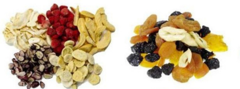
TABEL CU TIMP DE PREPARARE FRUCTE USCATE